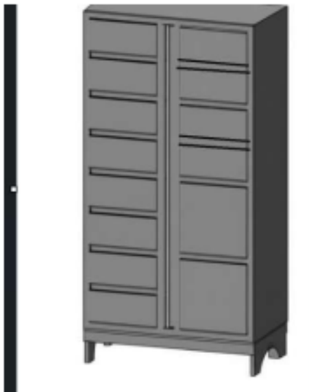
Armario 09 portas

DOIS ARMÁRIOS AUXILIARES DE 14 PORTAS CADA, SENDO 2 MÉDIAS E 12 PEQUENAS