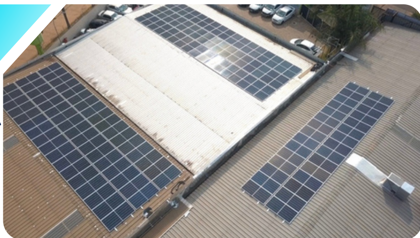
COMERCIAL - SCIA