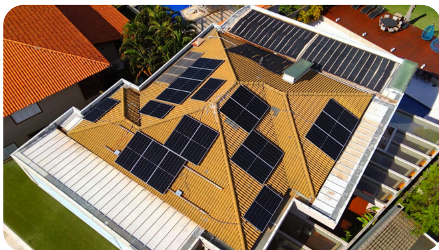
RESIDENCIAL - LAGO SUL